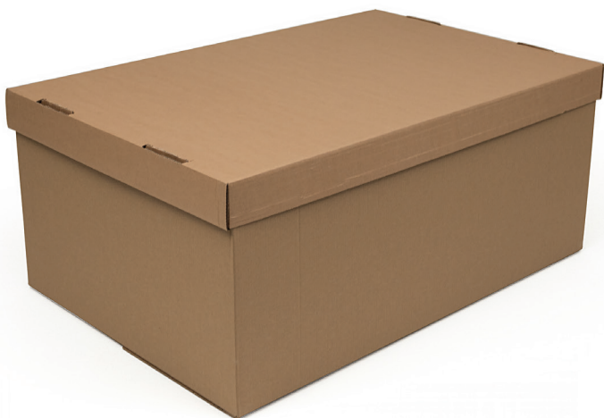
Wellcontainer med stansat lock

Viktbesparande, kan fås i riktigt kraftig well som kan ersätta träemballage mm. Lagring: Förvara gärna torrt, svalt och mörkt, det förlänger lagringstiden.