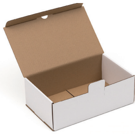
Stansad låda (vit/brun)