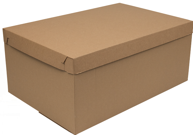
Wellcontainer med tårtlåsnings lock